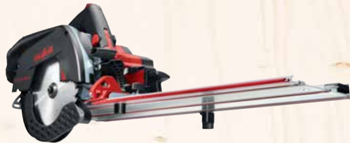
Kappschiene-Säge KSS 60 18M bl